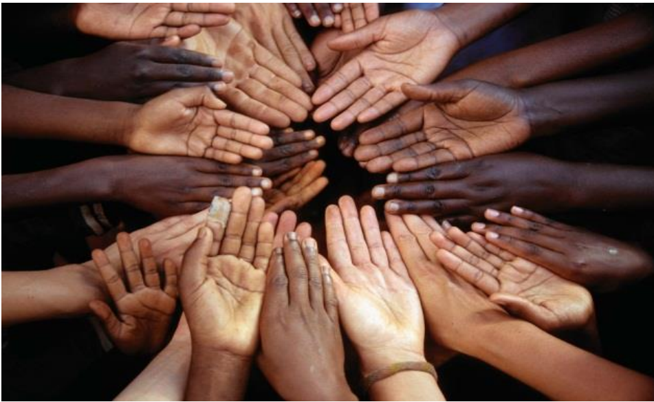
Foto JUST ONE WORLD to TAKE CARE of!